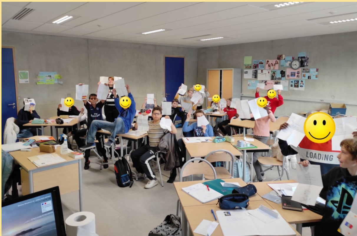
Les élèves de la section internationale heureux de recevoir les lettres de leurs correspondants espagnols !